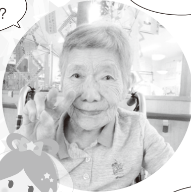
いろんな色で きれいなね!