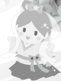
今年も 飾ったけんね