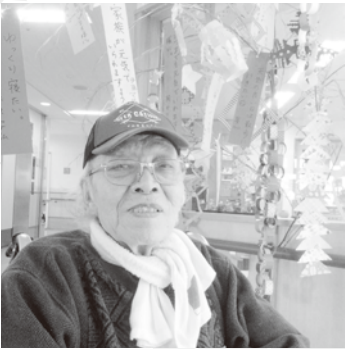
美人の織姫 おるか?