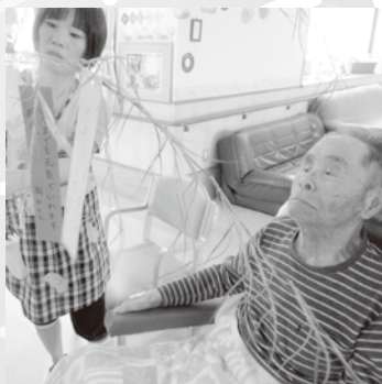
職員と入所者さんと一緒に...