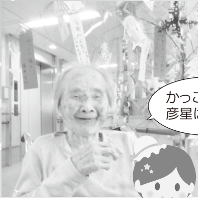
かっこいい 彦星はどこ?